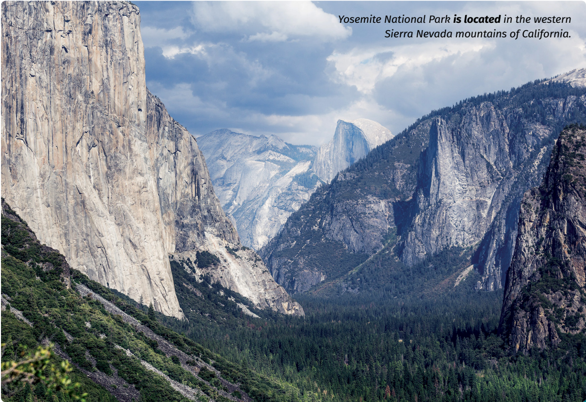
Yosemite National Park is located in the western Sierra Nevada mountains of California.