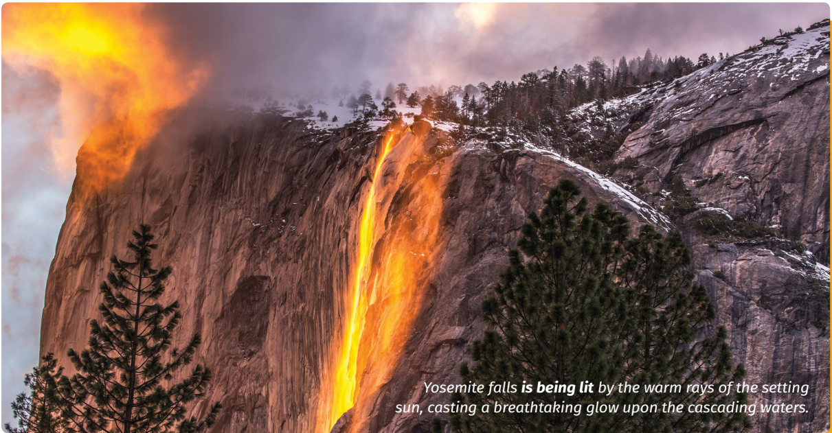
Yosemite falls is being lit by the warm rays of the setting sun, casting a breathtaking glow upon the cascading waters.