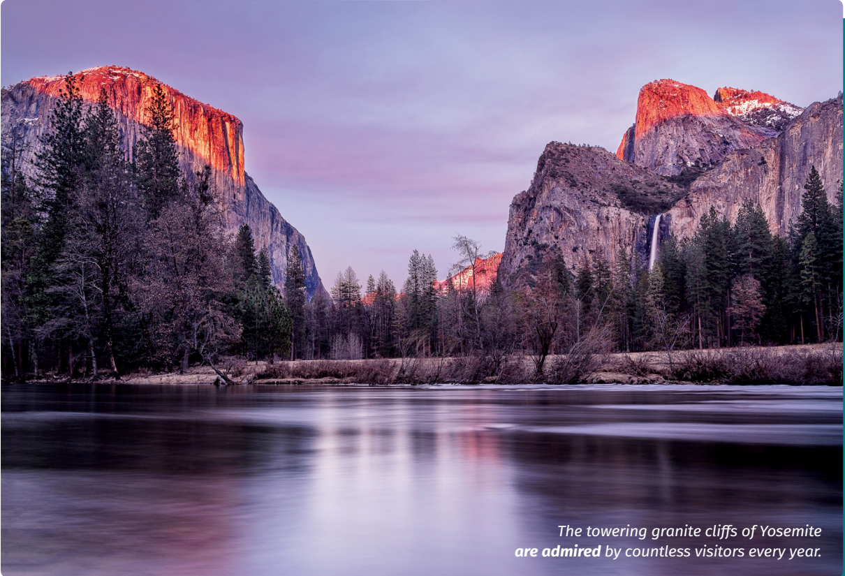
The towering granite cliffs of Yosemite are admired by countless visitors every year.